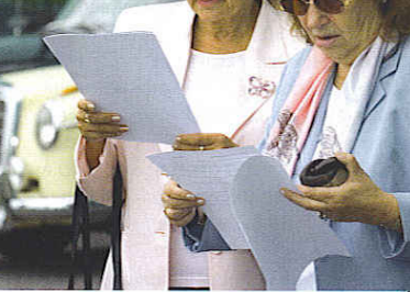
Sonntags morgens in Wuppertal: das Studium des Streckenverlaufs