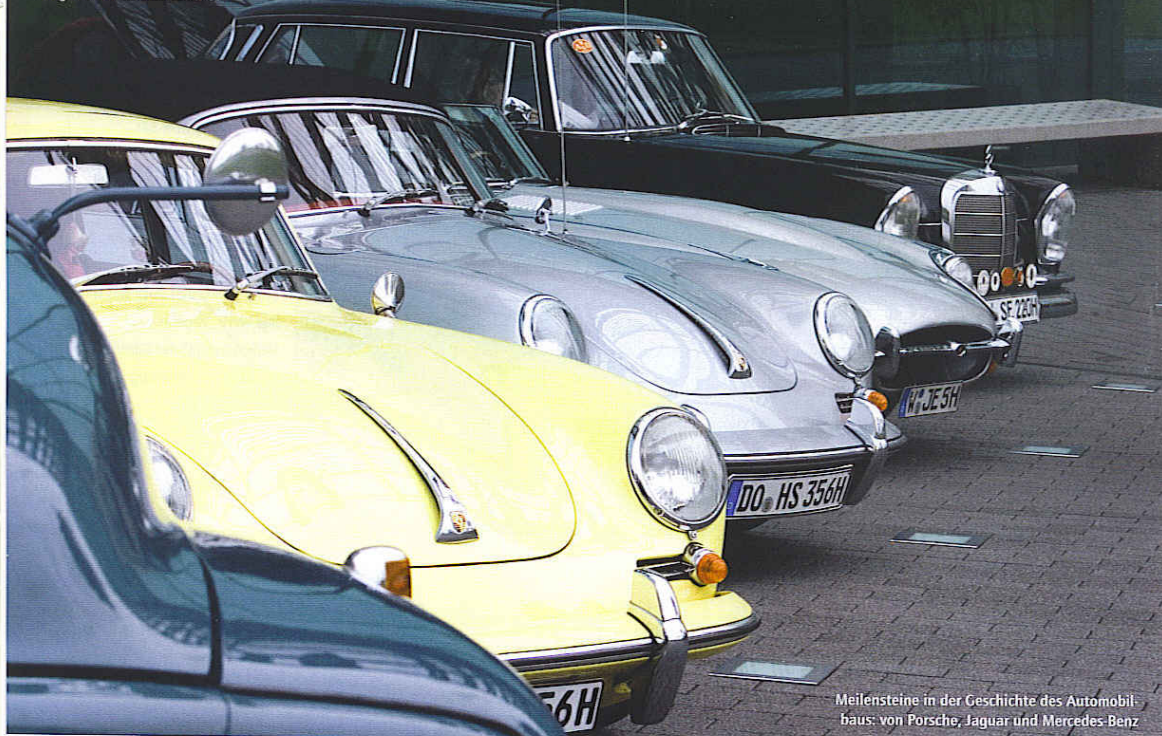
Meilensteine in der Geschichte des Automobilbaus: von Porsche, Jaguar und Mercedes-Benz