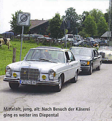
Mittelalt, jung, alt: Nach Besuch der Käseerei ging es weiter ins Diepental