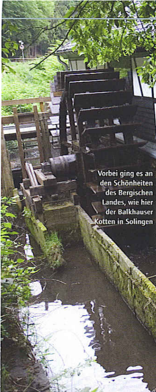
Vorbei ging es an den Schönheiten des Bergischen Landes, wie hier der Balkhauser Kotten in Solingen