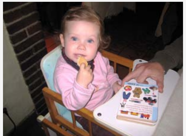
Die jüngste Teilnehmerin.