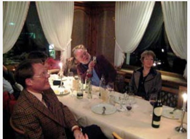
Nach phantasievoller Vorspeise kamen dann die mit Spannung erwarteten ganzen Gänse.