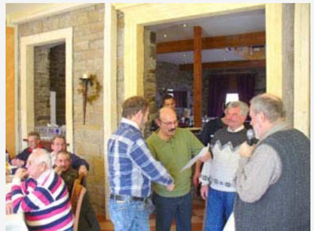
Der erste Preis wurde überreicht durch den Stifter „ KFZ-Technik Karagiannis “ (rechts)