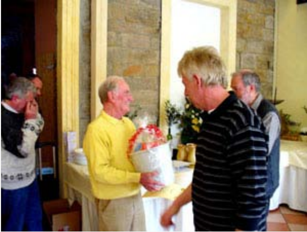
Der zweite Preis wurde überreicht durch den Stifter „ Auto Veidt GmbH “ Wuppertal, Pannen-dienste. (links)