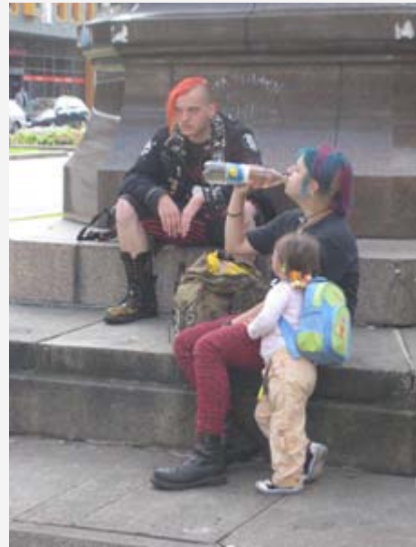
In mancher Hinsicht ist Erfurt natürlich eine Stadt wie jede andere Stadt.