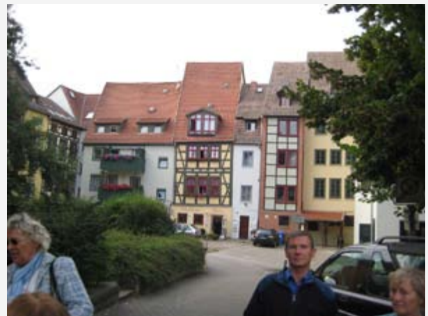
Erfurts Krämerbrücke ist eine einmalige Besonderheit. Wenn man sie erreicht und durchquert ist es eine bezaubernde historische Gasse mit kleinen Geschäften (Krämern) und Handwerkern.