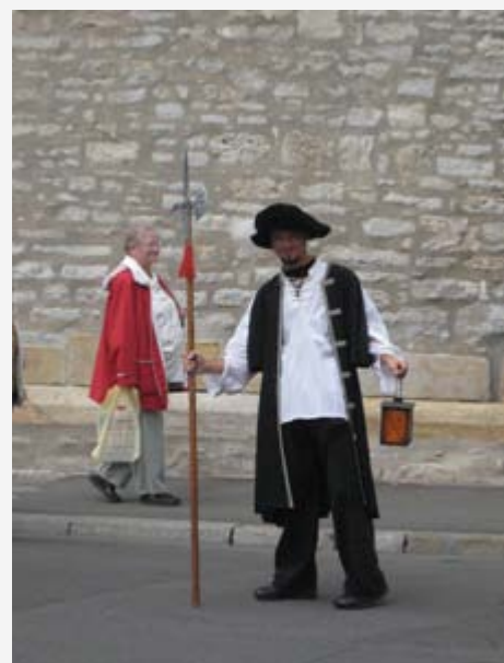
Der Nachtwächter von Erfurt