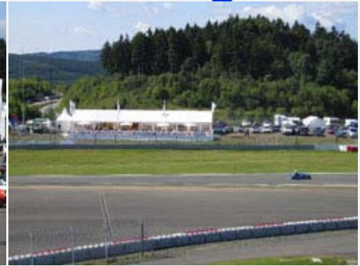
Der Standort unseres Campus mit dem weißen Großzelt und der Terrasse direkt an der Strecke war einmalig (oben links und Mitte).