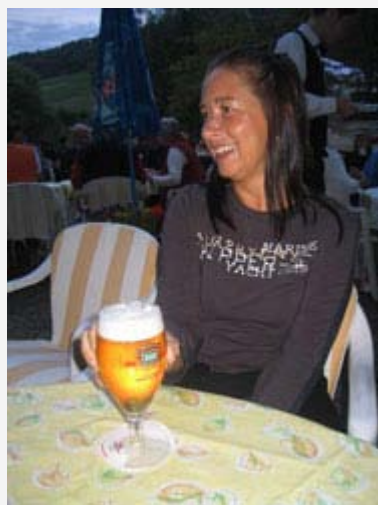
Was der einen ihr Bier ...