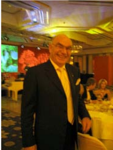
Vizepräsident Urbinger mit dem Unterhaltungsprogramm