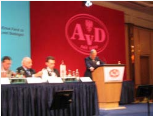
Der Präsident sagt etwas,