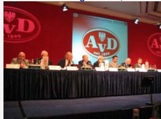
das Präsidium nach der Wahl.