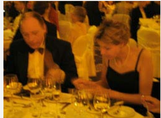
leitender Geschäftsführer Spinler und Frau mit dem Essen