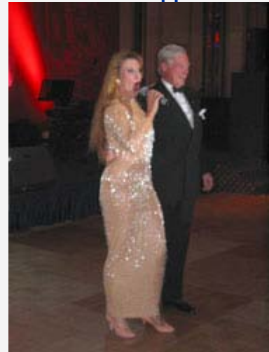
Unser AvD-Präsident, Fürst Ysenburg mit dem Stargast