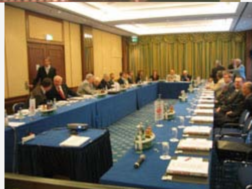
Sitzung des AvD-Ausschusses für Recht und Verkehr

Wie alle Jahre hatten auch in diesem Jahr die Götter vor den Erfolg bzw. das Vergnügen den Schweiß gesetzt. Es waren am Samstag, den 05. Juni zwei Arbeitskreise und eine Hauptausschußsitzung zu bewältigen.