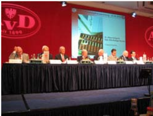
das Präsidium vor der Wahl,