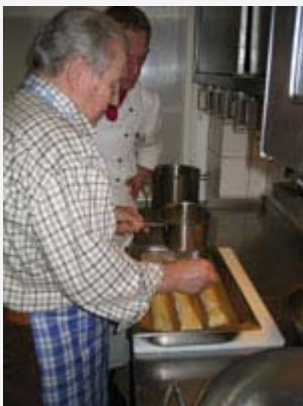
So sieht der Strudel nach dem Rollen und vor dem Garen im Backofen aus.