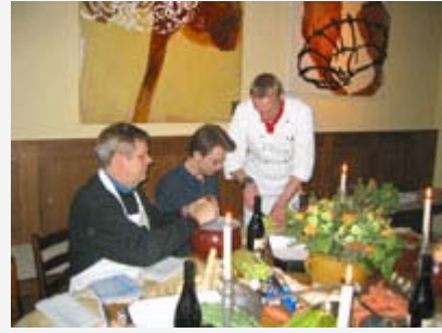
Es klappt noch nicht richtig, der Profi Kluckluck zeigt wie es geht.