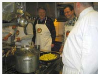
Die Drillinge werden noch einmal gekonnt gewendet.