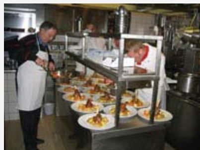
Die Teller werden perfekt vorbereitet und dekoriert.