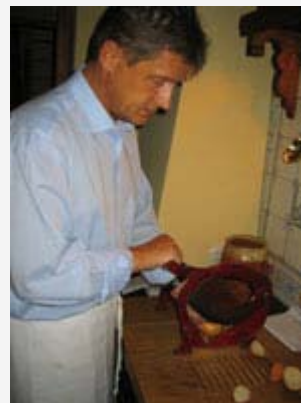
Brot wird geschnitten und ein großes Menue steht unmittelbar vor seinem Beginn.