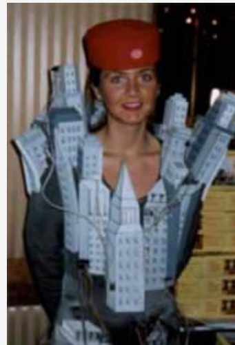
So sahen die guten Feen aus, die aus fast jeder Verlegenheit halfen, von der verlorenen Brieftasche bis zur vergessenen Zigarre.