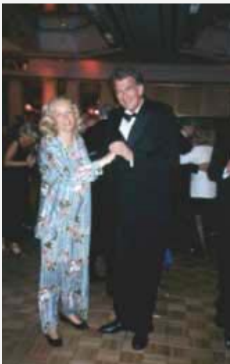
So sehen elegante Tänzer aus Wuppertal aus.

Kaum glaublich aber wahr, diese flotte Tanz- und Unterhaltungsband bestand aus einer Musiker-Auswahl aus dem Orchester, das zum Menue klassisch aufgespielt hatte.